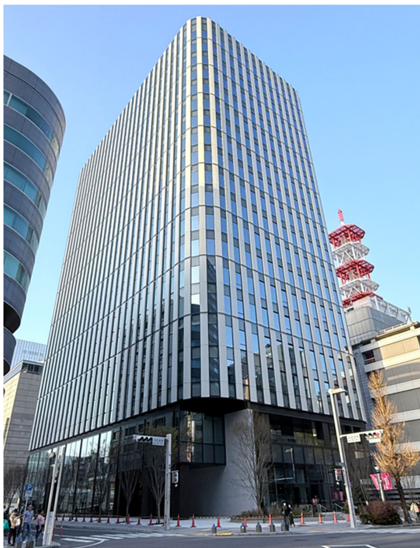
「栄トリッドスクエア」 (2026年3月竣工予定)