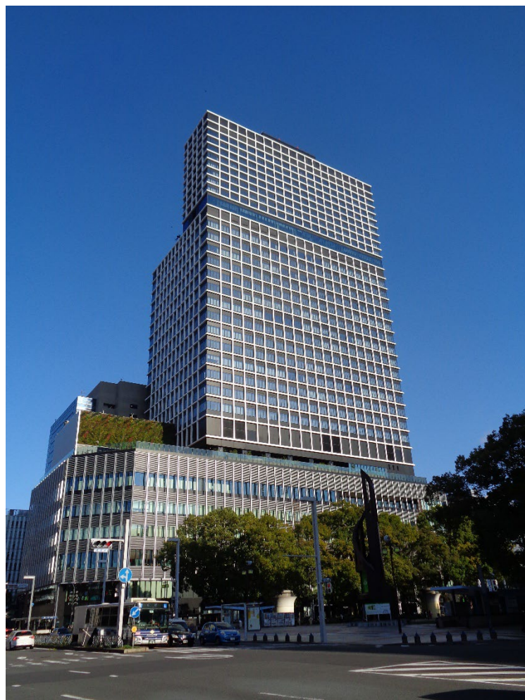
「中日ビル」 (2024年4月23日開業)