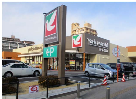
■ヨークマルシェ大和町店(2018年11月開業)