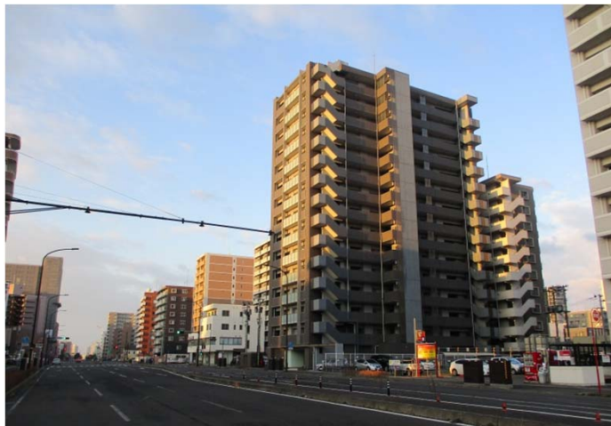
■住宅地上昇率1位となった宮城野-39