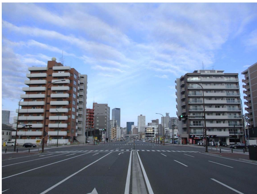
元寺小路福室線 二十人町交差点付近（宮城野区）