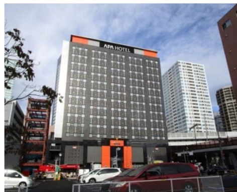
■アパTKP仙台駅北（2018年10月開業）